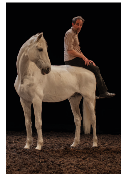
© ALYS THOMAS (GAGNÉ, C'EST BIEN NOUS SUR LE DESSIN!)

Amitié, crottin, liberté, sexe, virilité, tout y passe pour cette comédie acrobatique, poétique et drôle à 6 jambes.