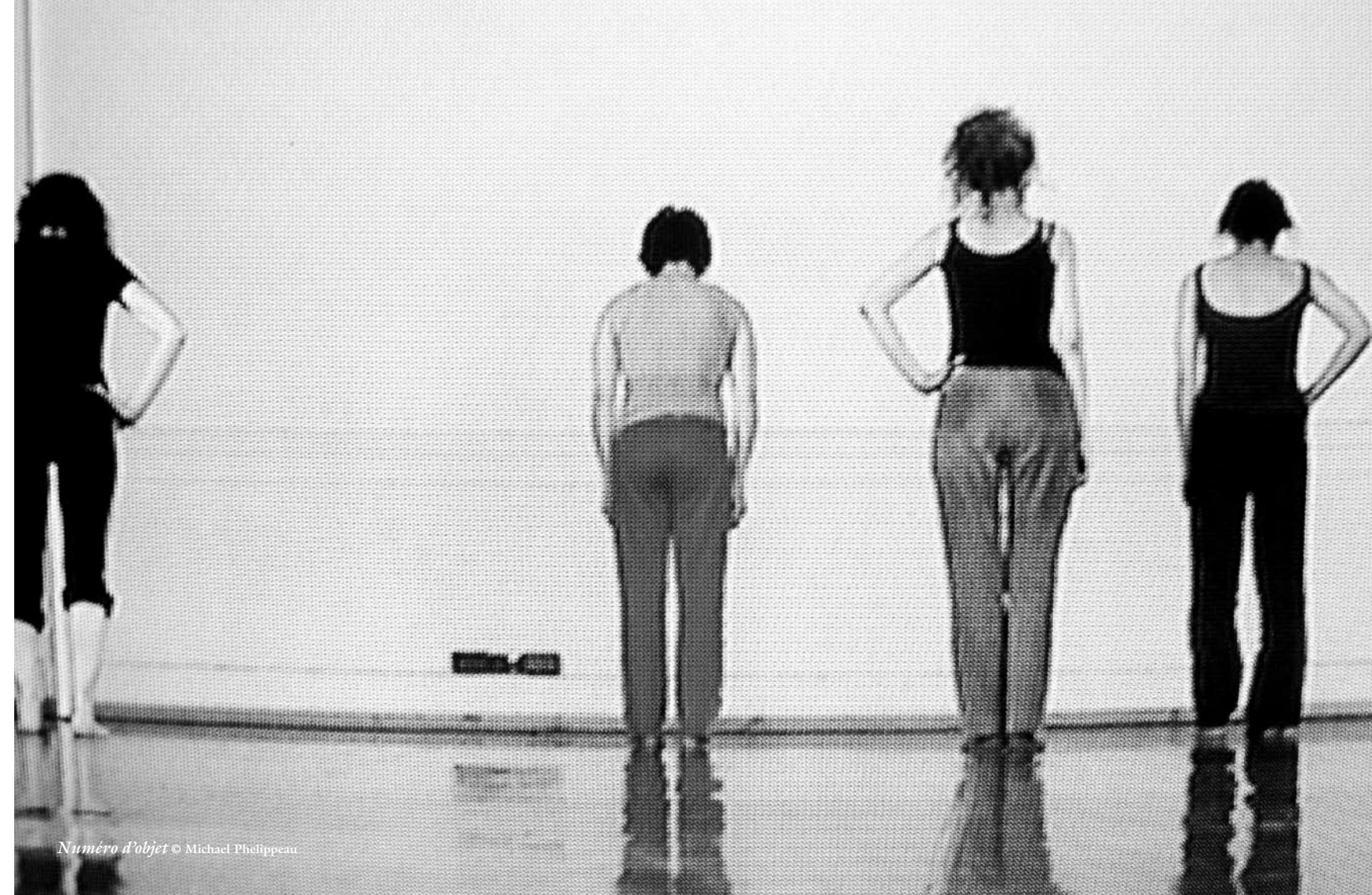
Numéro d'objet © Michael Phelippeau

Mercredi 14 décembre à 21h45, salle Vitez Rencontre avec Cécile Loyer et Mickaël Phelippeau