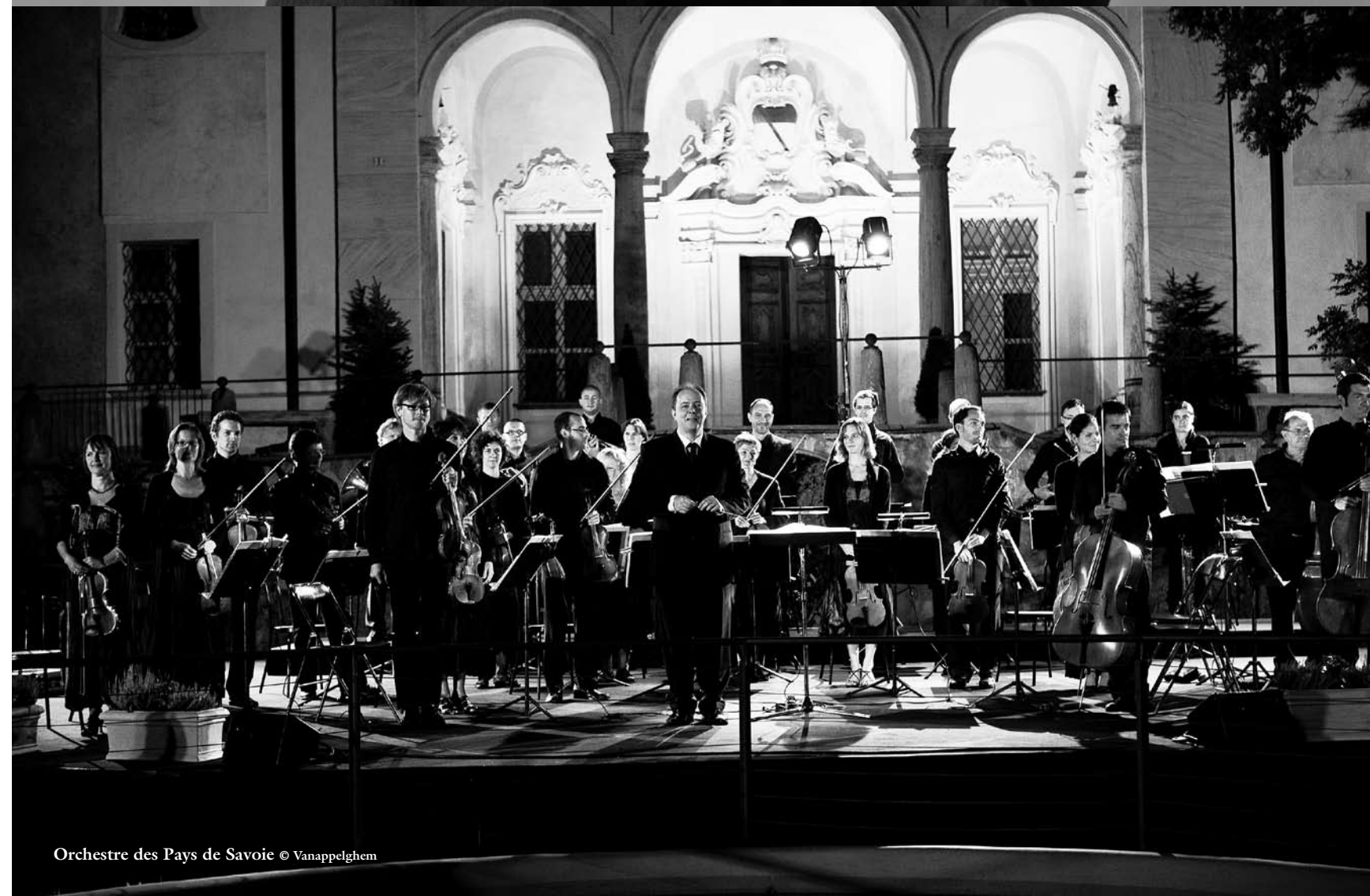
Orchestre des Pays de Savoie