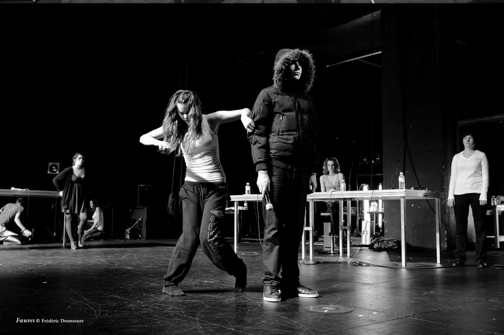
Fauves