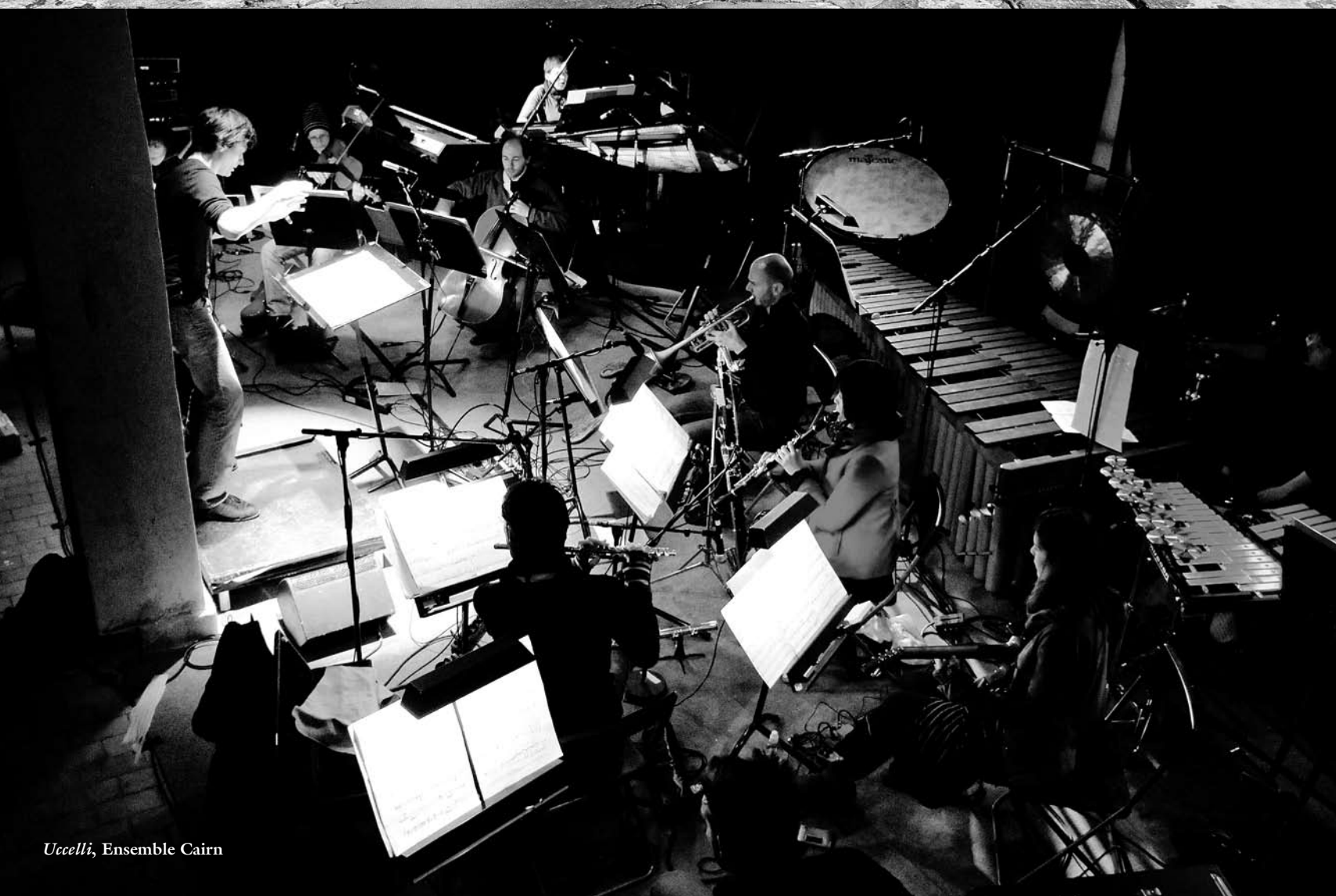
Uccelli, Ensemble Cairn