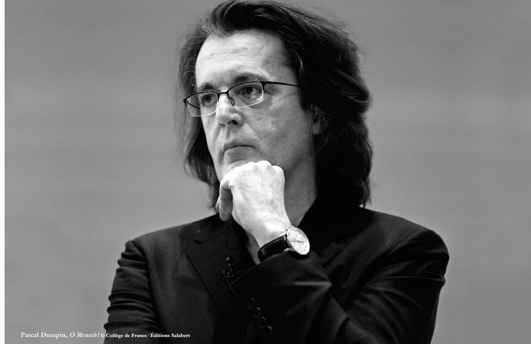
Pascal Dusapin, O Mensch! © Collège de France / Éditions Salabert

L'Orchestre des Pays de Savoie, créé en 1984, est un ensemble orchestral permanent comprenant 23 musiciens (19 cordes, deux hautbois et deux cors). Sous l'impulsion de ses chefs d'orchestre successifs, Patrice Fontanarosa, Tibor Varga, Mark Foster puis Graziella Contratto, l'Orchestre des Pays de Savoie est devenu l'une des formations françaises les plus dynamiques. Depuis septembre 2009, Nicolas Chalvin en assure la direction musicale.