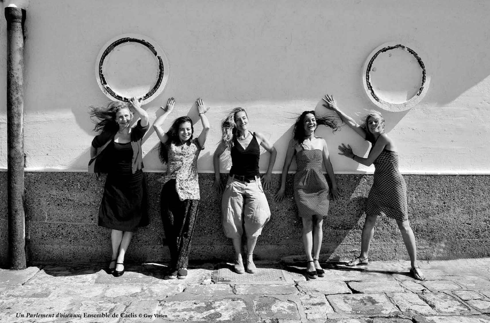
Un Parlement d'oiseaux, Ensemble de Caelis © Guy Vivien