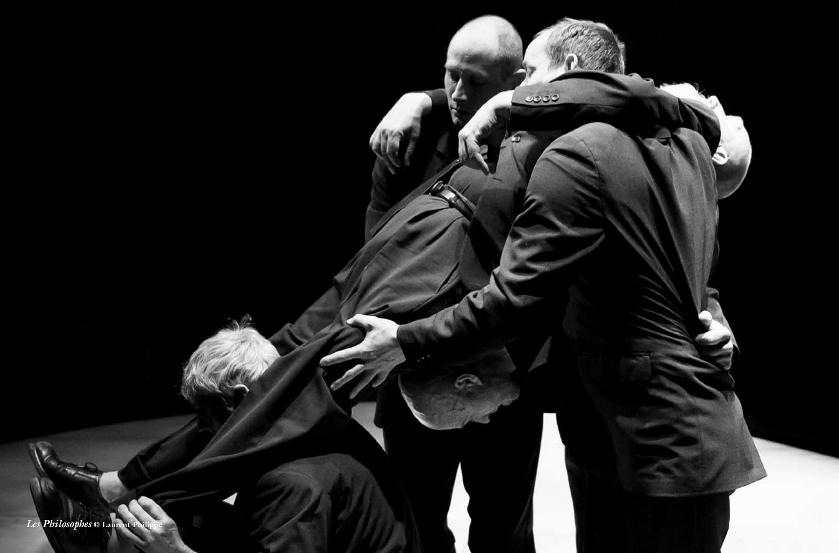
Les Philosophes