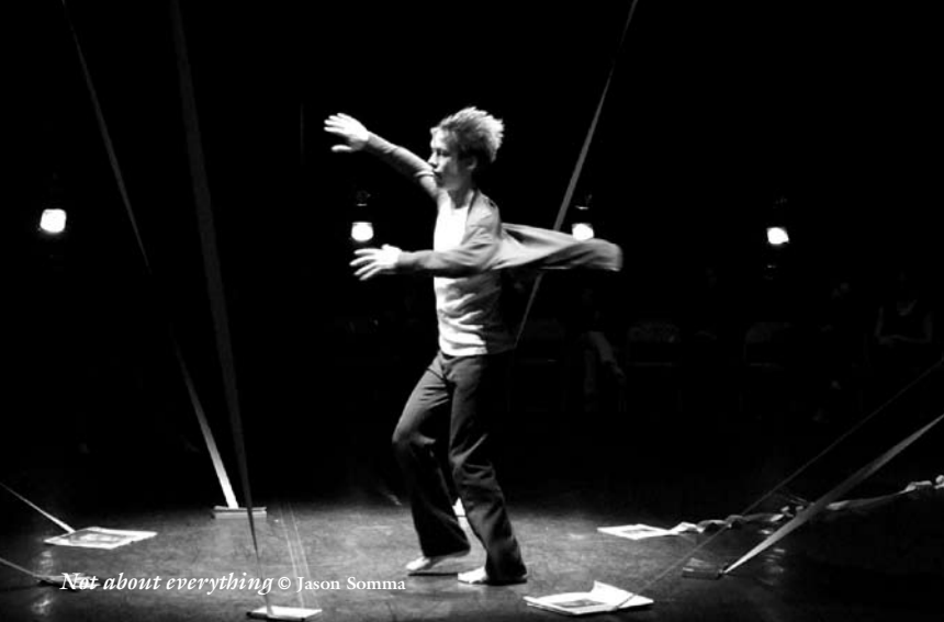
Not about everything © Jason Somma