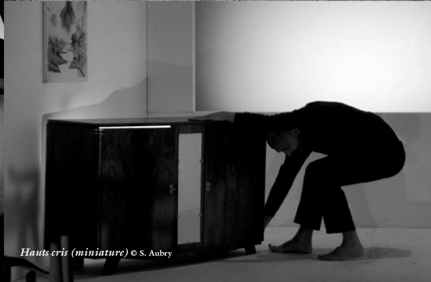
Hauts cris (miniature)