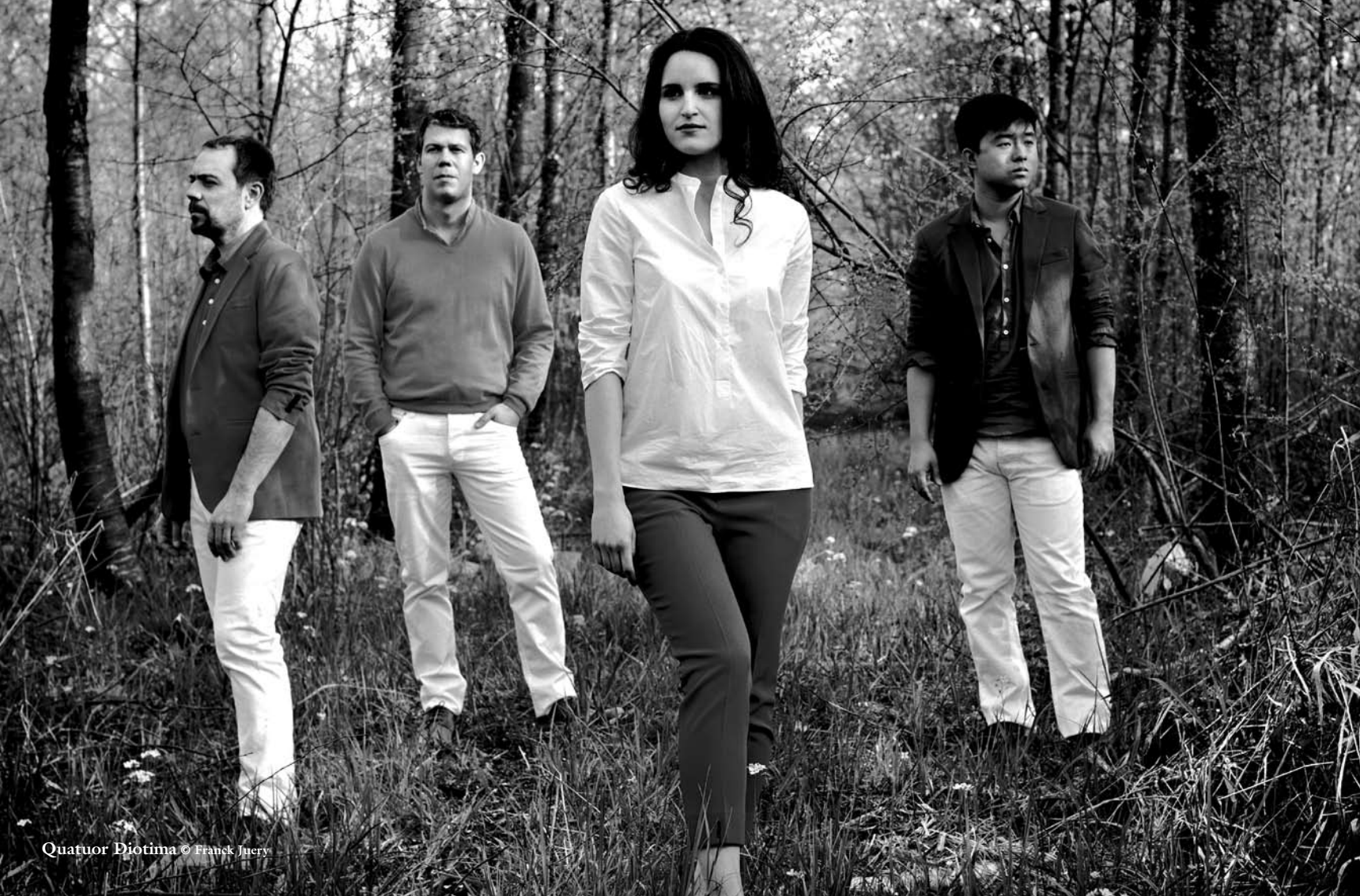
Quatuor Diotima