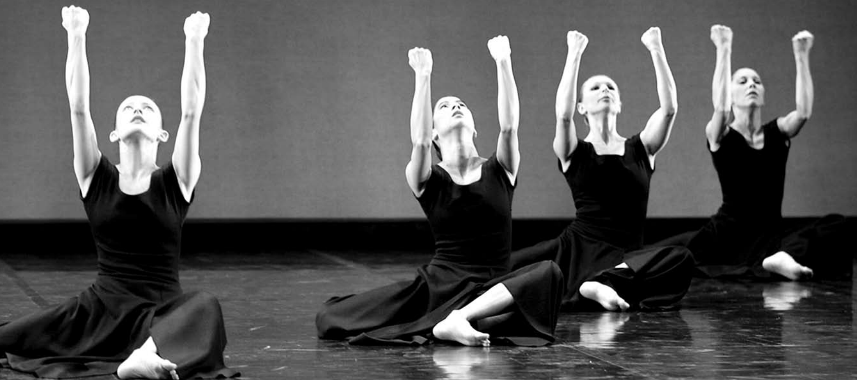
Ballet de Lorraine, Made in America