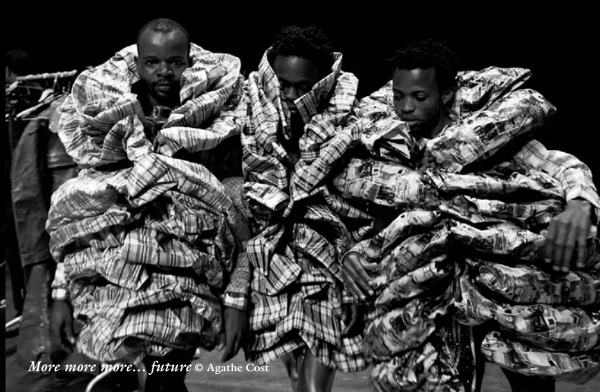
More more more... future © Agathe Cost