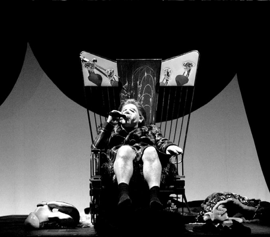
Deux masques et la plume