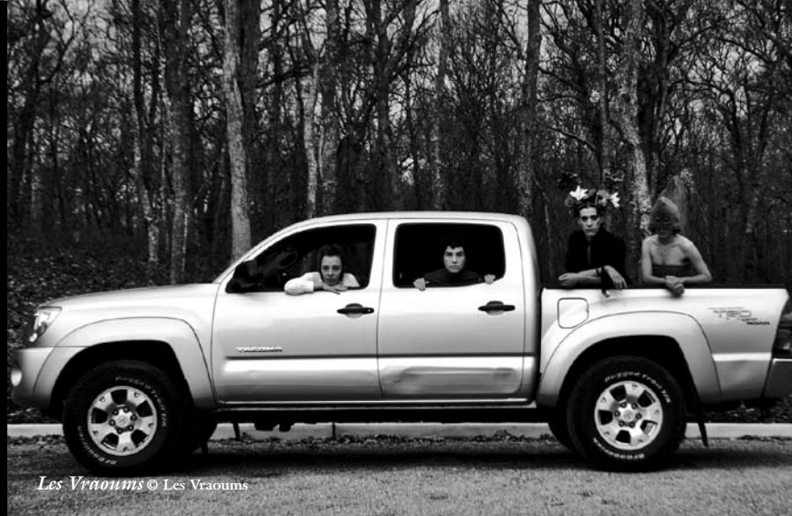
Les Vraoums