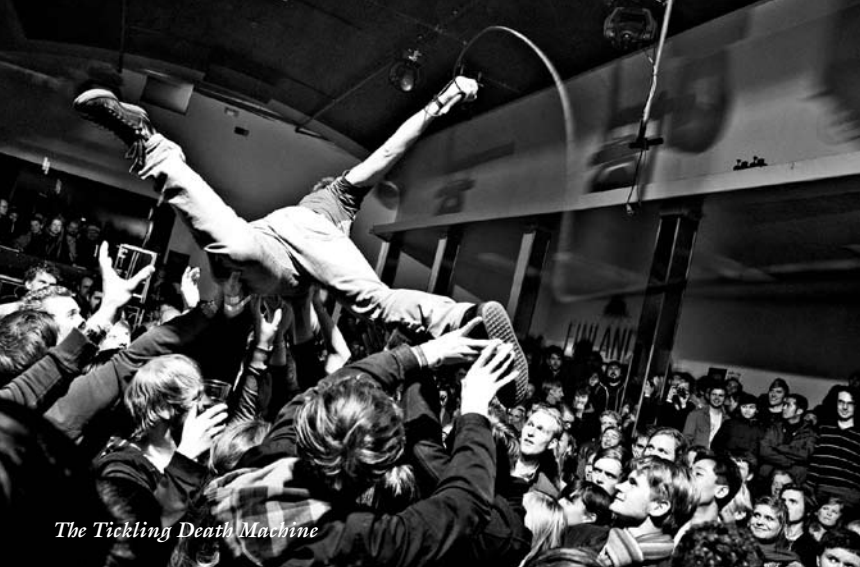
The Tickling Death Machine