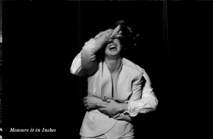
Measure it in Inches